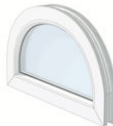
Bild 3: Verklebung von Profilen, die keine Stahleinlagen zulassen