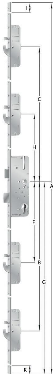
Schwenkriegel mit oder ohne Rundbolzen