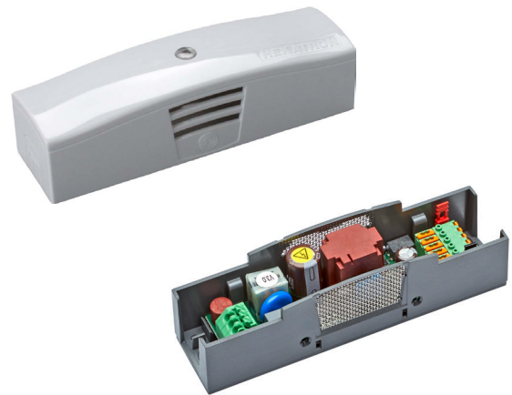
Feststellanlagen-Zentrale Kompakt mit Abdeckung

Die FSZ Kompakt ist eine Feststellanlagenzentrale in kompakter Bauform und eignet sich für den Einsatz an Brand- und Rauchschutztüren. Durch die sehr kleine und kompakte Bauform und ihr variables Design ist sie speziell für die Wand- und Sturzmontage geeignet. Sie besteht aus Netzgerät, Alarmspeicher und Betriebszustandsanzeige. Zum Einsatz kommt sie in Feststellanlagen in den verschiedenen Anwendungen in Industrie- und Verwaltungsgebäuden.