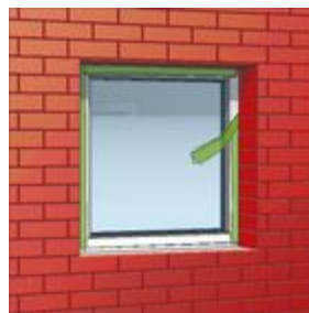
Bild 2: Zum gewünschten Zeitpunkt TP601 durch Abtrennen von Folie und Faden aktivieren.