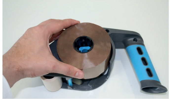
2. Klebeband einlegen