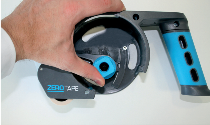
1. Kernaufnahme bis zum Einrasten nach oben drücken

Einlegen des Klebebands in den ZEROTAPE® Abroller: