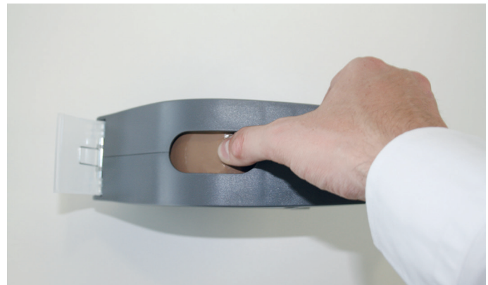
4. Klebeband durch die obere Öffnung nach unten drücken