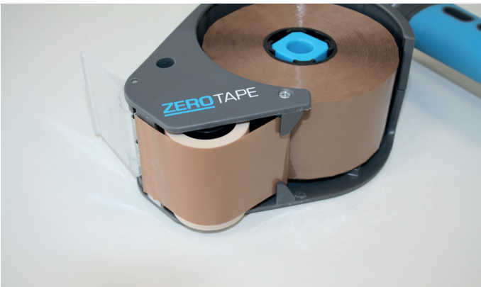
3. Klebeband bis zur Sicherheitsklinge ziehen